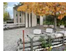
Bild 8: Arboretum mellan Åkeshovs T-bana och Hundstallet. Anlades 1998 och har nyligen upprustats. 64 skyltade träarter finns här samt örter, buskar och lökväxter. Bord, bänkar och vindskydd finns, där man kan sitta och njuta. https://vaxer.stockholm/projekt/akeshovs-arboretum/

Bild 7: Lekplatsen Båtsmanstorp i Riksby. Lekplatsen är anpassad efter synskadade och ingår i ett tillgänglighetsprojekt som Stockholms stad driver. Det syftar till att bygga bort hinder för människor med funktionsnedsättningar. Läs mer här: https://parker.stockholm/hitta-lekplatser-parklekar-plaskdammar/lekplats/lekplatsen-batsmanstorp/ .