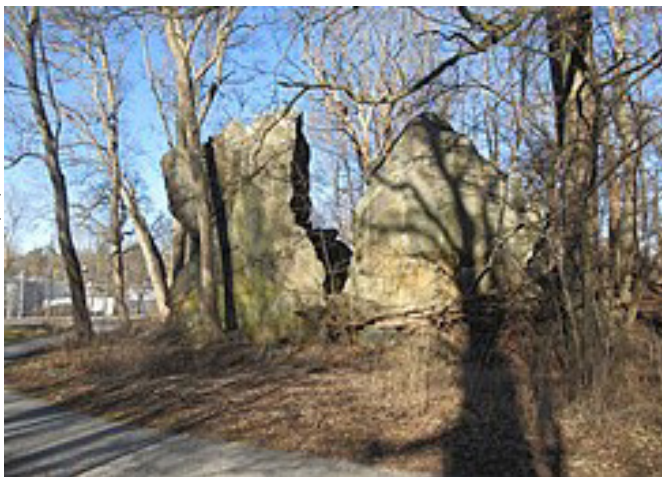
Dag och Delling.