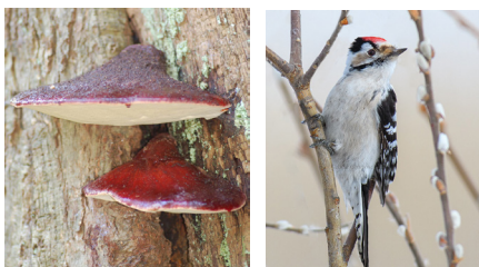
Oxtungsvamp och mindre hackspett