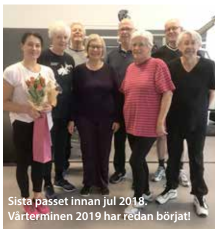
Sista passet innan jul 2018. Vårterminen 2019 har redan börjat!